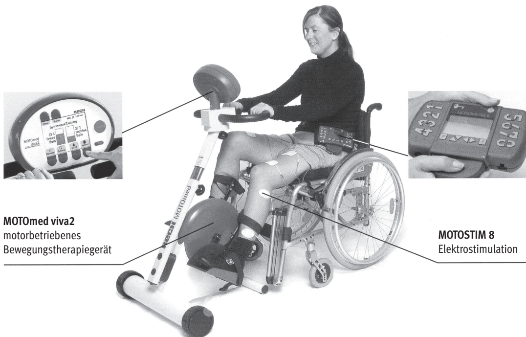
MOTOmed viva2 motorbetriebenes Bewegungstherapiegerät